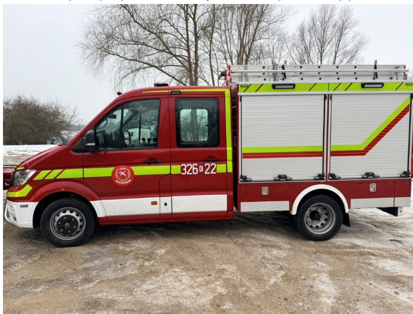
Fot. 5. Lekki samochód ratowniczy zakupiony w ramach dotacji w 2025 roku przez OSP Kryspinów