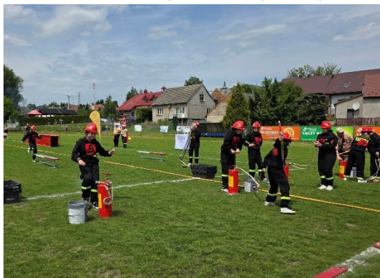
Fot. 21. Powiatowe Zawody Młodzieżowych Drużyn Pożarniczych z terenu powiatu krakowskiego w 2025 r.