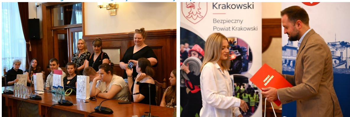
Fot. 23. Rozdanie nagród w konkursie „Twoja rodzina – Twoje bezpieczeństwo” w 2025 r.

Razem na konkurs wpłynęło 79 prac. Komisja konkursowa oceniła prace zgodnie z regulaminem i wyłoniła zwycięzców konkursu w czterech grupach. Zwycięzcom w/w konkursu wręczone zostały nagrody rzeczowe o łącznej wartości 14 975,00 zł, które zostały sfinansowane ze środków Wydziału Bezpieczeństwa i Zarządzania Kryzysowego w ramach programu „Bezpieczny Powiat Krakowski w latach 2024-2029”.