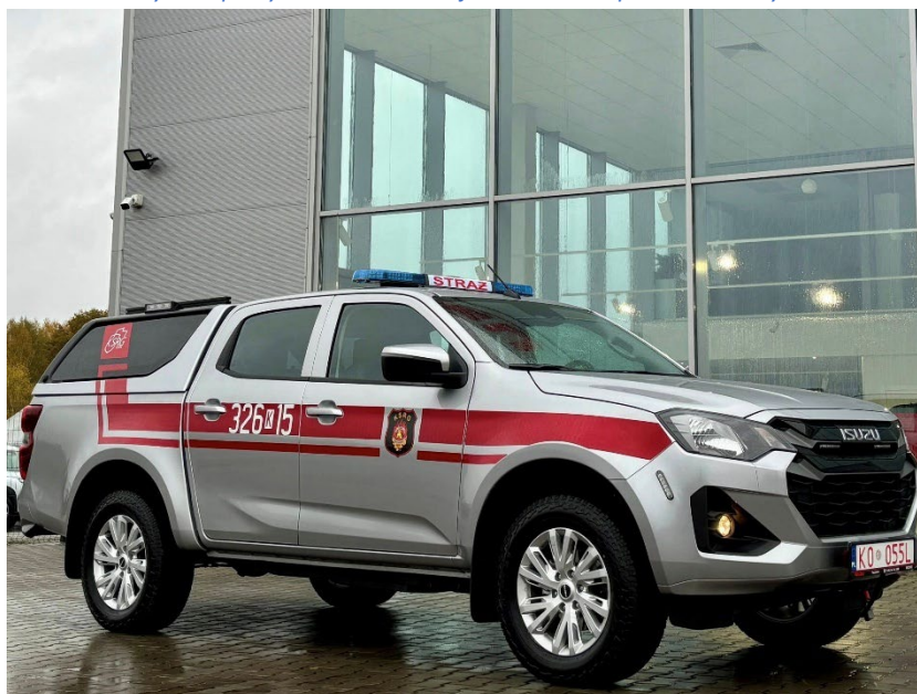
Fot. 6. Lekki samochód ratowniczy zakupiony w ramach dotacji w 2025 roku przez OSP Białe Kościół