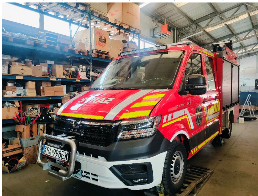
Fot. 4. Lekki samochód ratowniczy zakupiony w ramach dotacji w 2025 roku przez OSP Tenczynek