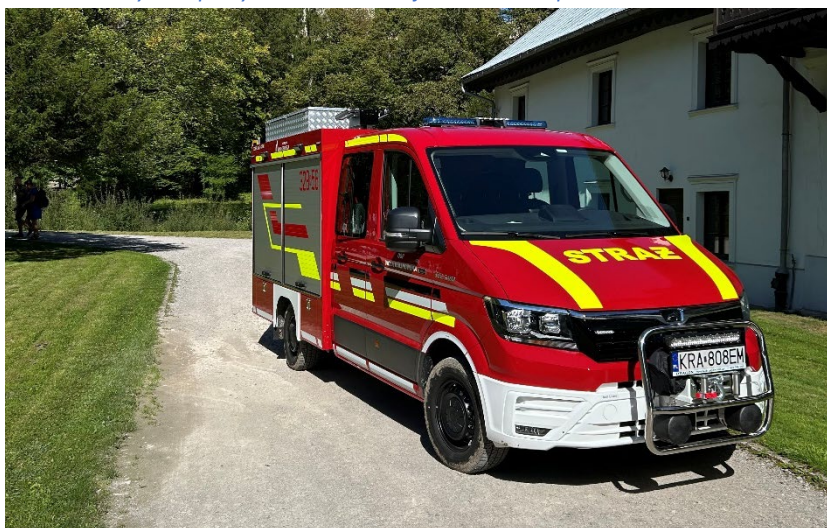
Fot. 2. Lekki samochód ratowniczy zakupiony w ramach dotacji w 2025 roku przez OSP Wola Kalinowska