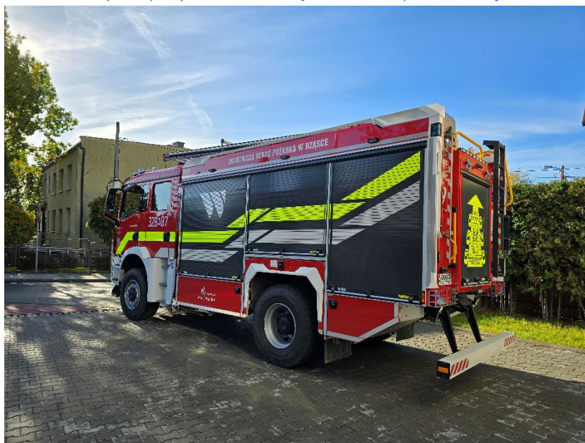
Fot. 1. Średni samochód ratowniczy zakupiony w ramach dotacji w 2025 roku przez OSP Rzęska