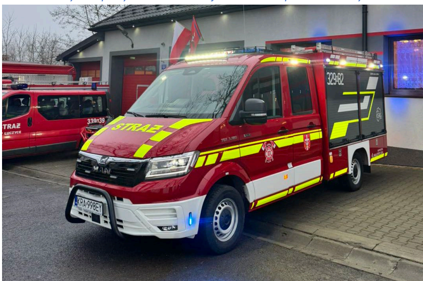
Fot. 3. Lekki samochód ratowniczy zakupiony w ramach dotacji w 2025 roku przez OSP Łuczyce