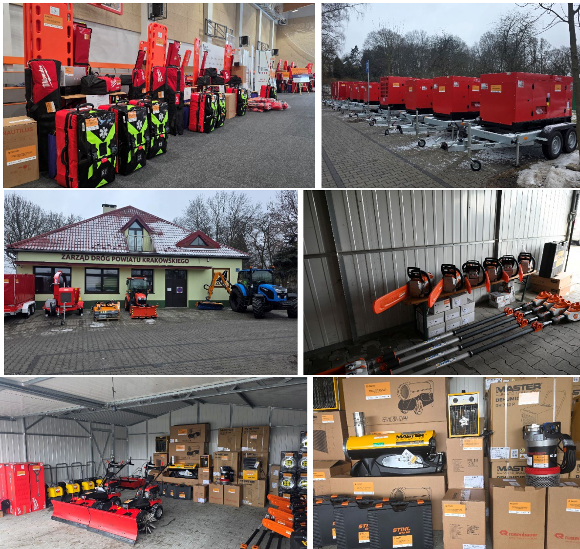
Fot. 12. Sprzęt zakupiony w 2025 r. w ramach Programu Ochrony Ludności i Obrony Cywilnej na lata 2025-2026 r.

Źródło: Wydział Bezpieczeństwa i Zarządzania Kryzysowego