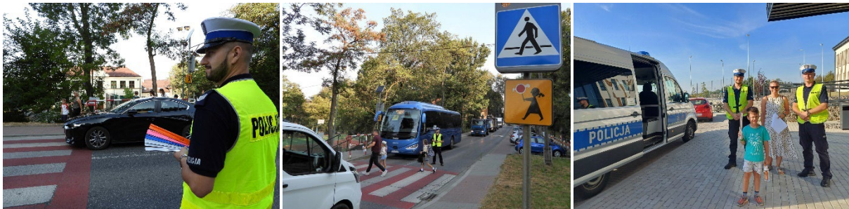
Fot. 15. Akcja „Bezpieczna droga do szkoły” i „Widoczny pierwszoklasista”