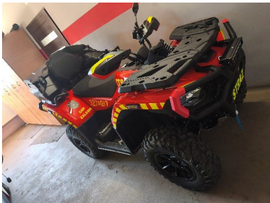
Fot. 7. Quadry zakupione w ramach dotacji w 2025 roku przez (od lewej) OSP Zalesie, OSP Wola Radziszowska, OSP Łązy, OSP Krasieniec Stary