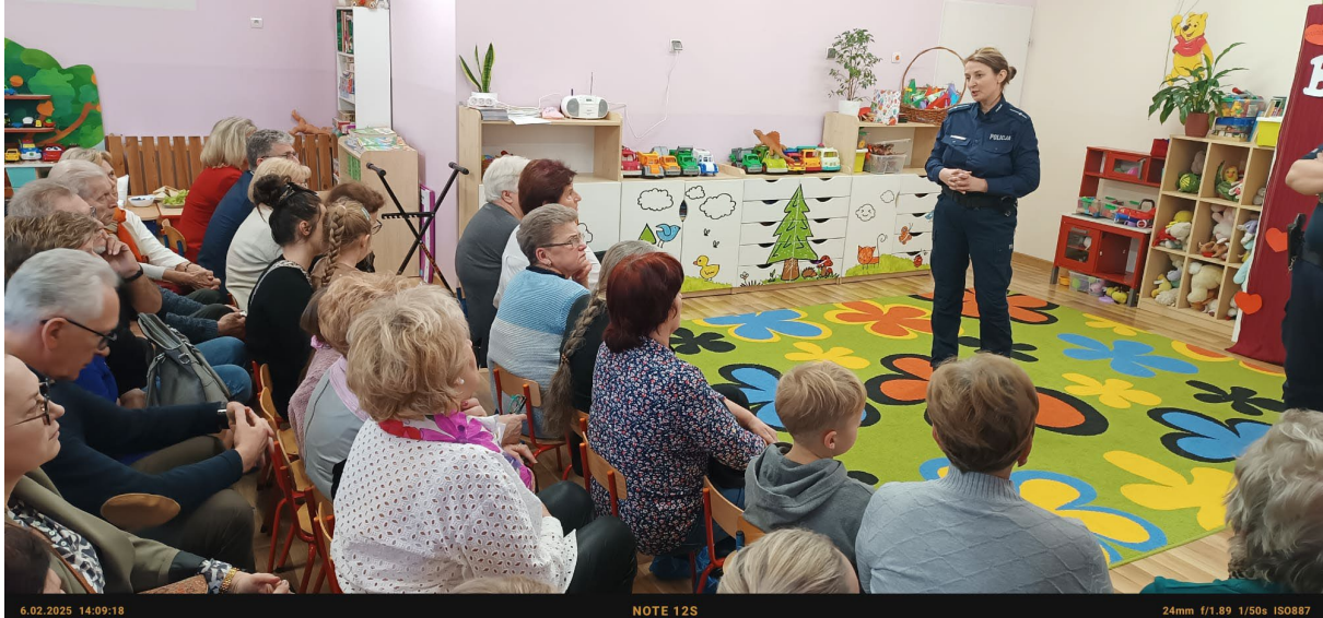
Fot. 13. Spotkania i zajęcia dydaktyczne dla dzieci i młodzieży prowadzone przez KPP w Krakowie w 2025 r.

zagrożenia w sieci pod kątem profilaktyki i reagowania oraz „niebieskiej karty” w praktyce szkolnej.