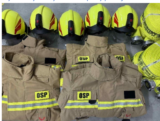
Fot. 9. Przykładowy asortyment zakupiony przez jednostki OSP w ramach dotacji celowej w 2025 roku