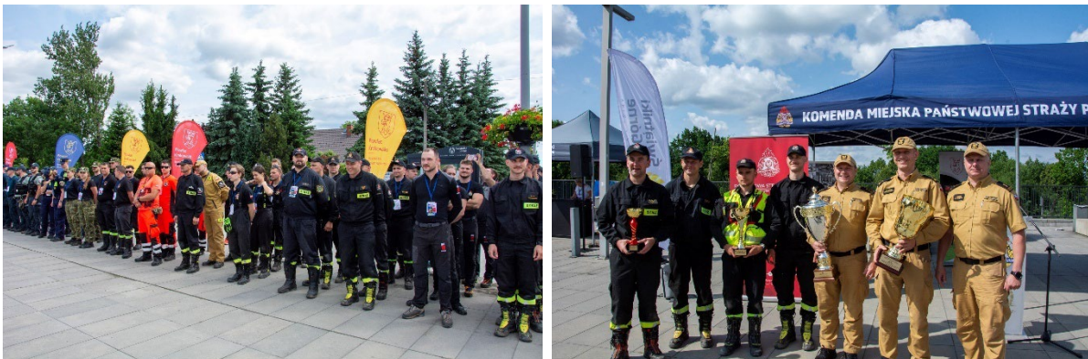
Fot. 18. Mistrzostwa Krakowa i Powiatu Krakowskiego w Ratownictwie Medycznym i Drogowym Służb Mundurowych 2025 r.

W eliminacji końcowej Zwycięzcą Mistrzostw i zdobywcą drugiego przechodniego pucharu Starosty została Jednostka Ratowniczo-Gaśnicza nr 4 w Krakowie. Jednostce tej uroczystie przekazano na stałe pierwszy Puchar Przechodni Starosty Krakowskiego bowiem wygrała ona zawody trzy razy z rzędu – w 2019 roku w Krakowie, w 2023 w Zabierzowie i w 2024 w Wielkiej Wsi.