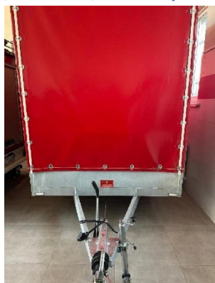
Fot. 8. Przyczepki zakupione w ramach dotacji w 2025 roku przez (od lewej) OSP Nowa Wieś Szlachecka, OSP Wołowice, OSP Złotniki, OSP Goszcza, OSP Siedlec, OSP Nawojowa Góra, OSP Nowa Góra, OSP Włoszą, OSP Wielmoża, OSP Rzeszotary