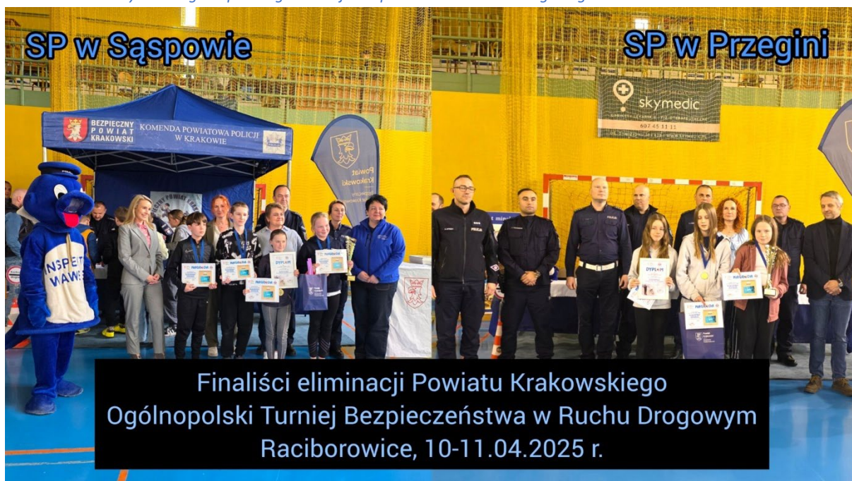
Fot. 14. Powiatowy Finał Ogólnopolskiego Turnieju Bezpieczeństwa Ruchu Drogowego w 2025 r.