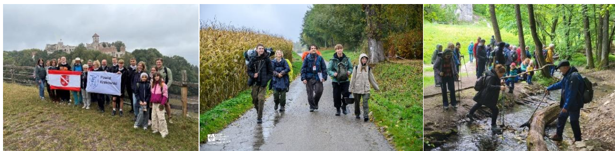
Jurajska historia i natura na wyciągnięcie ręki, XXX Rajd Hufca Podkrakowskiego ZHP, 53. edycja akcji „Nie siedź w domu – idź na wycieczkę” – 75 lat Koła Grodzkiego PTTK