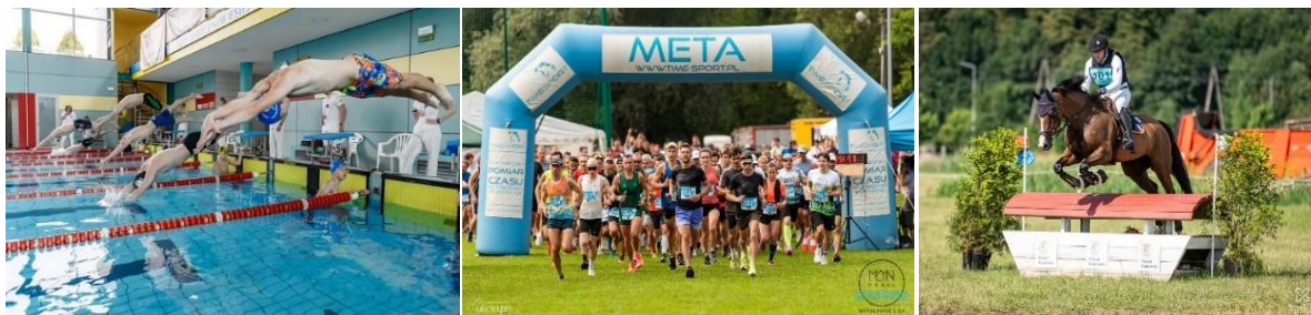
XVI Pływackie Mistrzostwa Skawiny, Zawody Młyn Trail Michałowice, Zawody Międzynarodowe w Jeździectwie – Facimiech Horse Trials