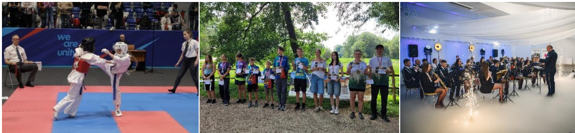
IV Mistrzostwa Małopolski Karate Kyokushin, Mistrzostwa Polski w Orientacji Precyzyjnej, Koncert Cecyliański

Przykładowe wydarzenia zrealizowane w ramach Patronatu Starosty Krakowskiego: