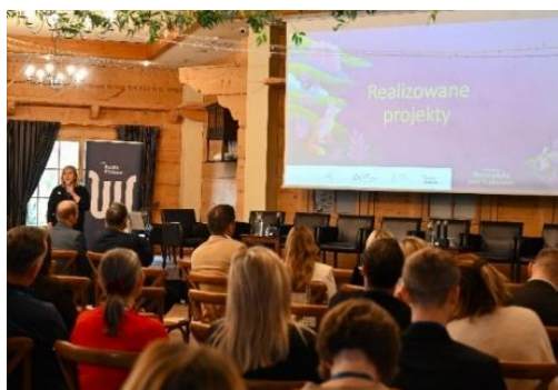
Piknik z polotem, Konferencja „Ekoturystyka pod Krakowem”