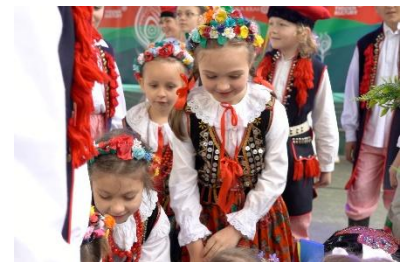
J-labs Skała Race, Obrona Zamku Tenczyn przed Szwedem 1655, Przeгляд Folklorystyczny im. Janiny Kalicińskiej „Spinka Krakowska” 2025